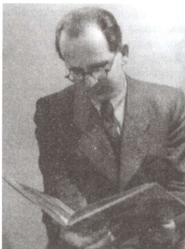
Gombosi György 1943-ban.

vészetről írt másik munkája az Új magyar rajzművészet , amelynek tervezett második kötete már nem készülhetett el. Tanulmányának elméleti részében a modern rajznak a natúrától való eltávolodását, spontaneitását – nem számolva a ténnyel, hogy mind az absztrahálás, mind az ösztönösségre való törekvés döntő mértékben tudatos momentumok – a tudatalatti feltárásaként értelmezi. Hitet tesz a „tiszta rajz”, az „eredendő rajzi módszerek”, a „helyes rajzi látás” mellett. Vallja, hogy a rajznak „ősi törvényszerűségei” vannak, amelyek érvényesülése esetén „az anyag megelevenedik és önkéntelen tolmácsolójává válik az öntudatlan érzéseinek és szándékainak”, más szavakkal: „valamilyen transzszzerű mediális kapcsolat keletkezik a tudatalatti és a rajzoló szerszám között” 17 A tanulmány-